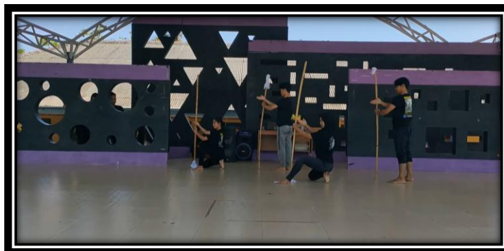
Gambar 5. Tampilan koreografi sederhana hasil kegiatan pelatihan oleh kelompok kreatif 1