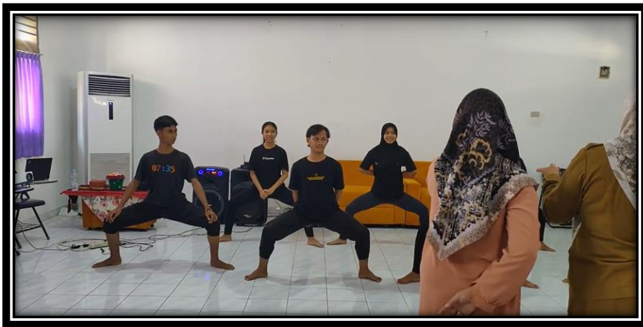
Gambar 3. Proses seleksi penari oleh Kelompok 3

Kegiatan pelatihan hari pertama berlangsung dengan sangat baik dan sesuai dengan jadwal yang sudah dirancang. Terdapat sedikit pergeseran pada waktu pelaksanaan proses seleksi yang disebabkan cukup selektifnya para peserta selaku koreografer dalam memberikan instruksi saat proses seleksi. Kegiatan di hari pertama diakhiri dengan sesi foto bersama dengan formasi komplit pemateri dan peserta pelatihan.