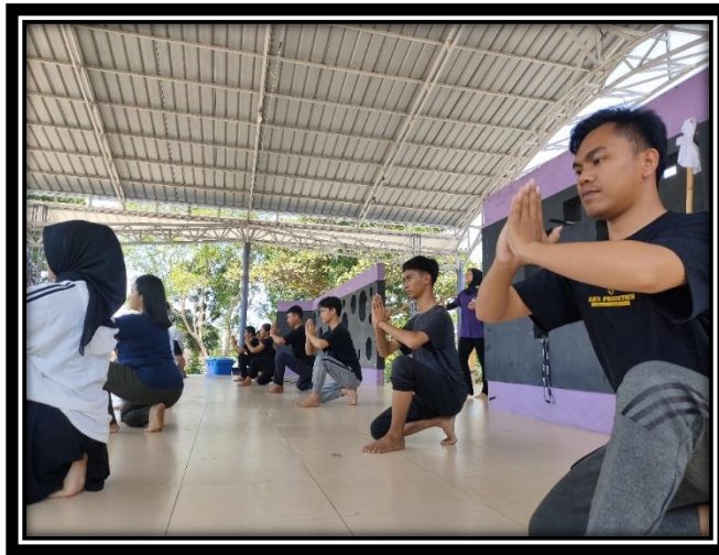
Gambar 4. Peraga membantu mencontohkan teknik gerak Tari Khakot di hadapan peserta pelatihan

melihat progress dari para peserta. Seluruh peserta diminta untuk mengimitasi teknik dan bentuk gerak Tari Khakot baik yang gerak tari solo hingga berpasangan. Seluruh peserta tampak antusias mengikuti pelatihan ini. Meskipun, sebagian peserta pelatihan bukan merupakan guru seni budaya dari lulusan pendidikan seni. Sesi ini menjadi cukup seru, sebab peserta melakukan dengan antusias dibantu dengan para peraga.