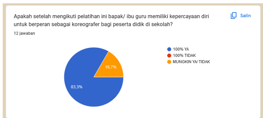
Gambar 6. Hasil survei peserta pelatihan

serta seluruh respon menunjukkan sangat tertarik untuk mengikuti kegiatan pelatihan serupa yang diselenggarakan selanjutnya.